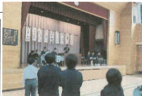
↑代表生徒による質問の様子

生徒総会の当日は、厳粛な雰囲気始まり、それぞれが自分の仕事をしっかりと果たし、立派にやり遂げることができました。生徒会担当の教員として印象的だったことは、生徒一人ひとりが真剣に話を聞き、より良い学校生活を実現するために意見を交わっていたことです。ぜひ青山中学校の生徒の活動を知っていただきたいので、どのような目標が掲げられたか、ご紹介したいと思います。